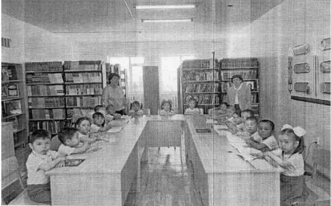
екмухамбетова атындағы мектеп- гимназиясына саяхат жасап, мектептің ты тіршілігімен танысып өтті. -