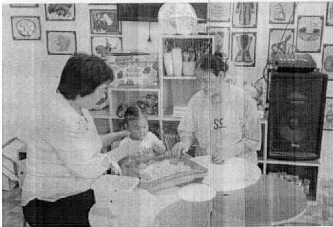
Ата-аналарға кеңес беру пунктінде баланың балабақшаға қызығушылығын арттыру мақсатында кеңес берілді.